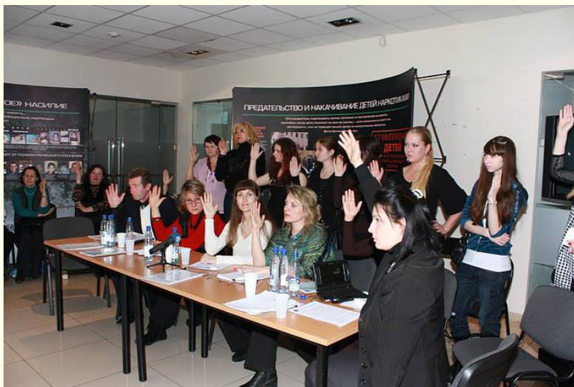
Круглый стол против ювенальной юстиции. Голосование за резолюцию