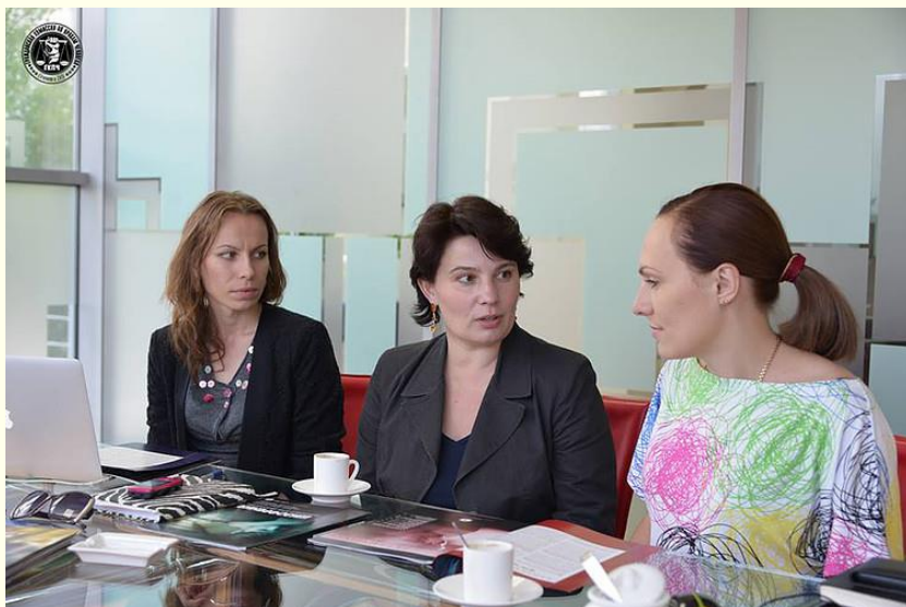
Президент Гражданской Комиссии по правам человека в России Софья Доринская с правозащитниками в Киеве. 2008г.