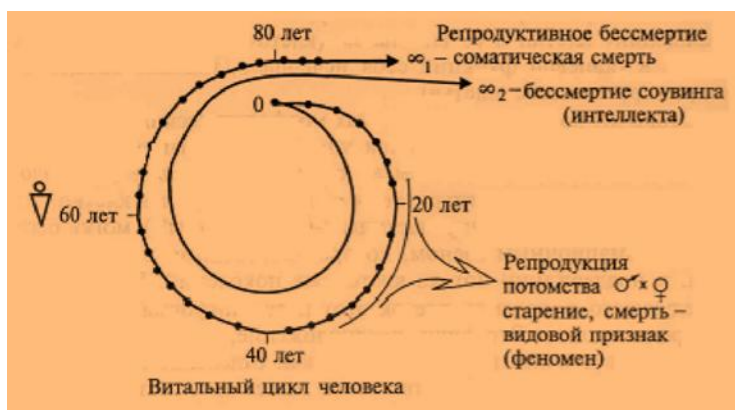
Рис. 2. Жизненный цикл человеческого индивидуума определяется программами П-1 (видовое бессмертие 1, связанное с воспроизводством поколений) и П-2 (социальное и интеллектуальное, творческое бессмертие 2, выраженное вкладом в становление цивилизации и культуры).

По-существу, эти обобщающие работы постепенно выводят современную теорию медицины из горизонта широких представлений клинической медицины России периода Боткина, Захарьина, Пирогова . В то время очень многие клиницисты подчёркивали, что болезнь должна рассматриваться, на первом уровне, как изменения жизнеспособности человеческого организма ( М.Я. Мудров ). В этих изменениях могут присутствовать системы, органы, функции, определённые возрастные категории больного или здорового человека. В наших работах мы несколько раз описывали этот индивидуальный цикл, расширяя, таким образом, известные сегодня работы по конституциям В.И. Шапошниковой (Ленинград). Мы приводим эту схему индивидуального цикла. (Рис. 2).